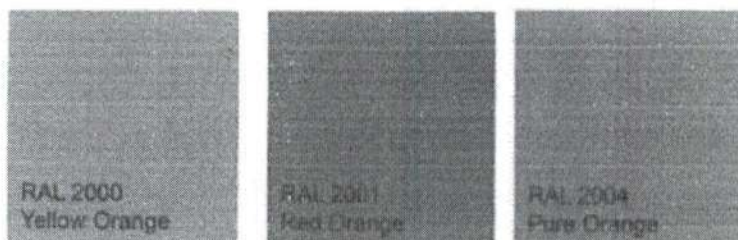
Figura 22 – imagem da série RAL 2000 - laranja